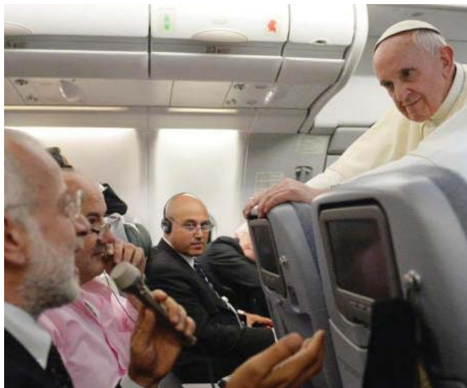
Papa Francesco tra i giornalisti

Banalità? Forse. Ma è esattamente di questi problemi che tratta - con ben altra autorità, s'intende - il messaggio di papa Francesco per la cinquantunesima Giornata mondiale delle comunicazioni sociali, che si celebrerà il prossimo 28 maggio, giorno dell'Ascensione, reso noto il 24 gennaio (festa di san Francesco di Sales, patrono dei giornalisti). Il titolo