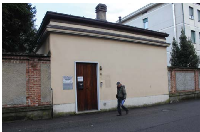
La Caritas di via Alfieri