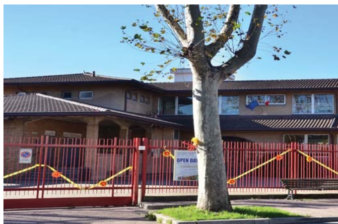
L'oratorio S. Ambrogio di viale Edison