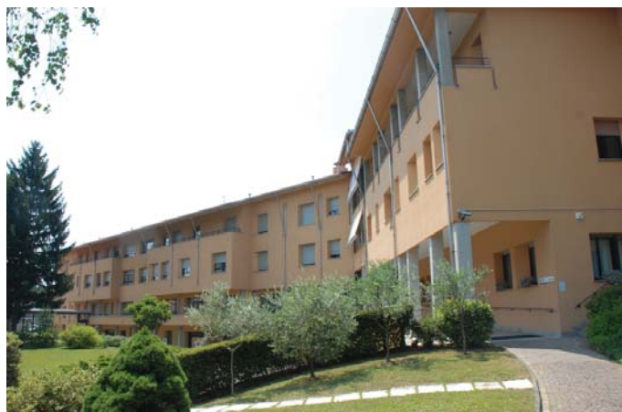
L'Opera Don Orione di via Verdi

Ovviamente tutte le organizzazioni e associazioni che operano nei sei centri del decanato sono state invitate a partecipare all'iniziativa con i propri operatori, soci e amici e a diffonderla tra i cittadini affinché la condivisione di un momento così significativo sia la più ampia possibile. L. L.