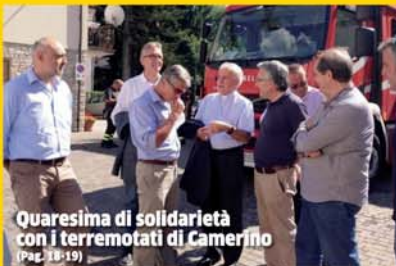
Quaresima di solidarietà con i terremotati di Camerino (Pag. 18-19)