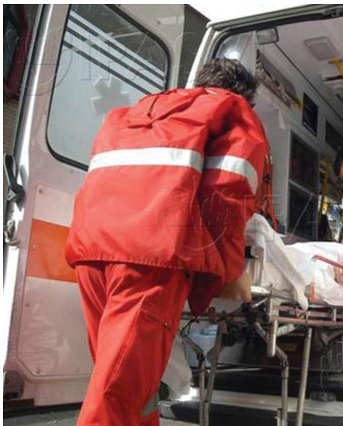
Volontariato storicamente molto attivo