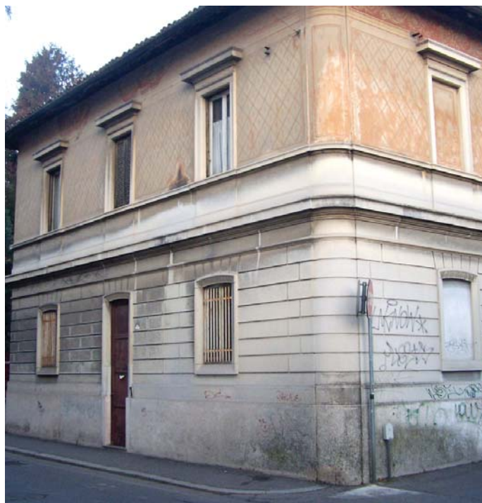
La palazzina del parco 25 aprile