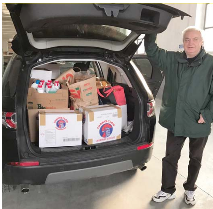
Un 'autista' con il carico di pacchi

Tuttavia, due punti ci avevano colpito in modo particolare: era estremamente semplice, anche per noi che avevamo poco tempo e due figli piccoli. Inoltre, ci avevano spiegato che tutto ciò che veniva raccolto era destinato ad aiutare famiglie residenti sul territorio, dunque una risposta ad un'esigenza molto vicina, ma che non pensavamo esistesse nella ricca Brianza.