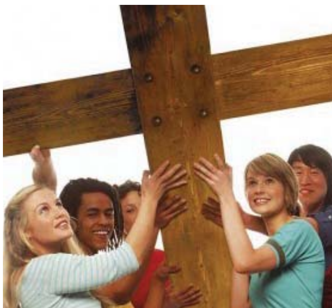
I giovani della Gmg di Cracovia 2016

Oggi l'accostamento giovani-vocazione appare quasi come una provocazione nel nostro contesto di fluidità e incertezza. In questo senso sembra che prima di ingegnarsi riguardo alle possibili tattiche da mettere in atto per "attirare" i giovani alla vita della Chiesa,